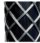
(2-lagig / verstärkt)