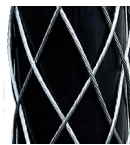
(1-lagig / Standard)

Siehe Tabelle. Andere Längen auf Anfrage!