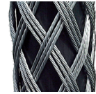
(3-lagig / verstärkt)