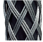
(3-lagig / verstärkt)