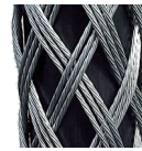
(3-lagig / verstärkt)