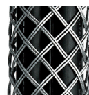
(2-lagig / Standard)